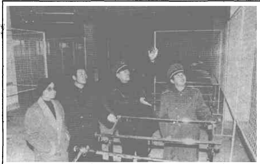
△ 东营光彩大厦是东营工商分局依靠社会力量集资建设的，寓集贸、商厦、餐饮、娱乐、仓储为一体，各楼层都配有高档、实用、美观的营业设施。